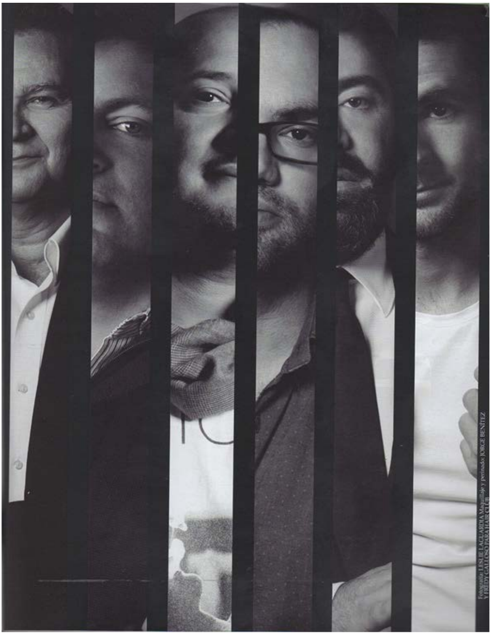
Marquillaje y peinados: JORGE BENTREZ Y FREDDY GALLOSO PARA HAZER CLUB