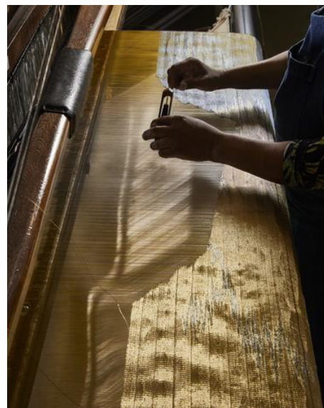
En hechizoo trabajan con 60 artesanos en el taller