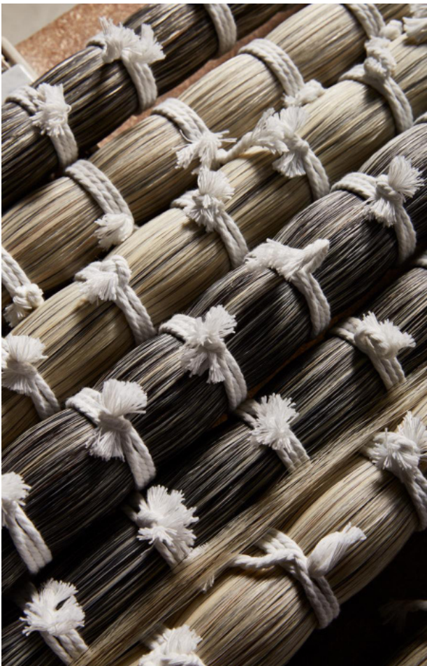
La crin de caballo de Mongolia tejida con metal y seda es la mezcla más ecléctica con la que han trabajado en hechizoo

Así como una fibra por sí sola no tiene mucho significado o importancia, cuando se unen unas a otras y empiezan a componer esa pieza que nació solo a partir de palabras, es cuando la magia comienza