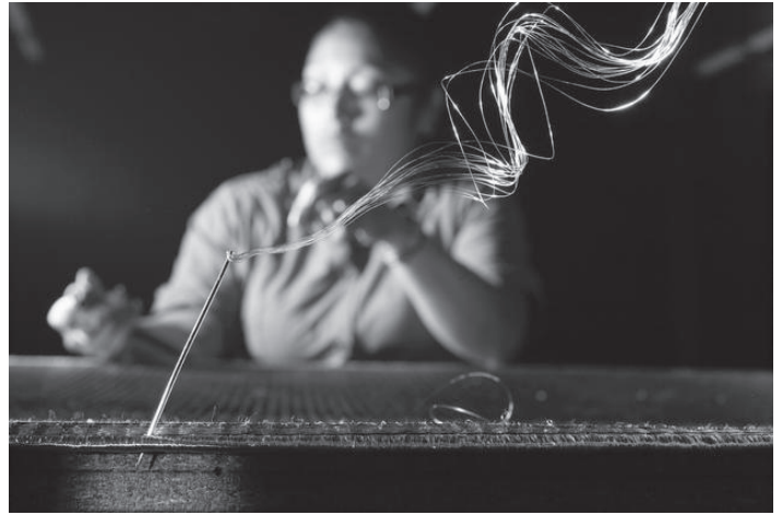
Cada pieza de hechizoo conlleva un minucioso trabajo artesanal que requiere tiempo, mimo y destreza