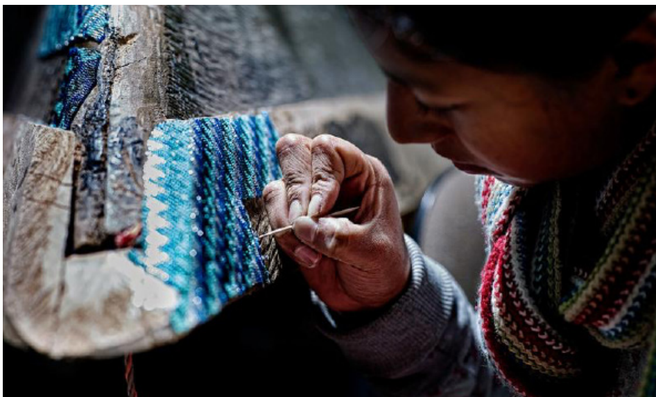
La mezcla de fibras vegetales con otros materiales como el metal o el cristal japonés en este caso, forman parte de la esencia de hechizoo