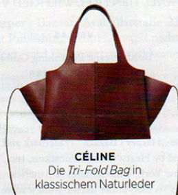
CÉLINE Die Tri-Fold Bag in klassischem Naturleder