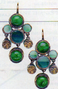
BOTTEGA VENETA Silberohrringe mit Malachit