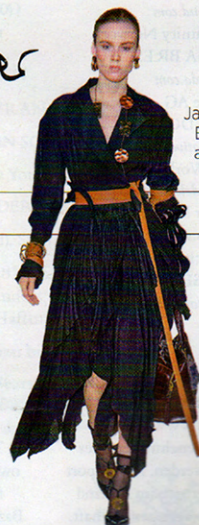
LOEWE Jacke-Rock- Ensemble aus Seide