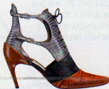
DIOR Schnürstiefeletten mit Cut-outs in metallisierter Echsen-, Krokodiler- und Tejus-Optik